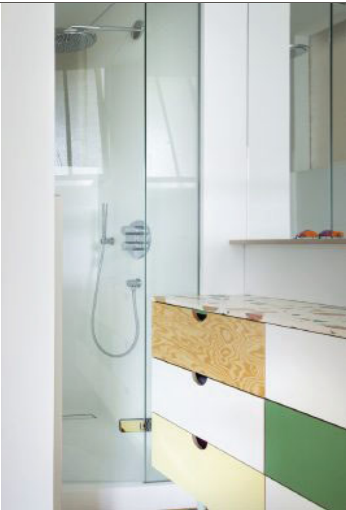
Ook in de badkamer: terrazzo.