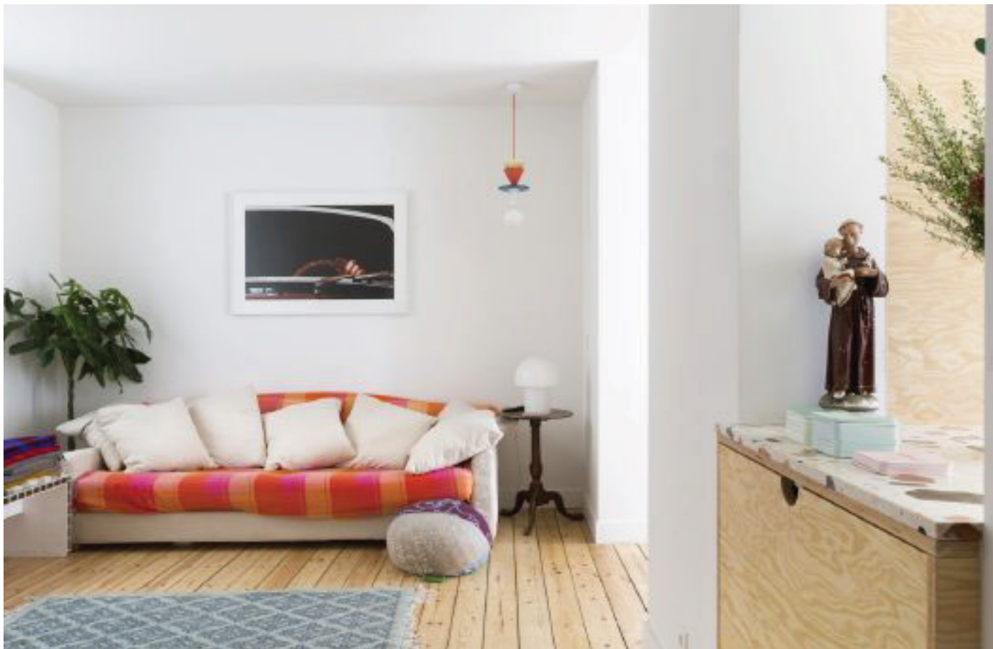
Sofie De Clercq is niet bang voor kleur en kitsch. Op de kast met terrazzoblad rechts een van de heiligenbeeldjes die ze verzamelt.